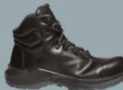
FOOD TRAX 5010857