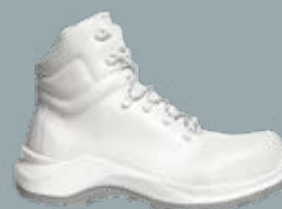
FOOD TRAX 5012857